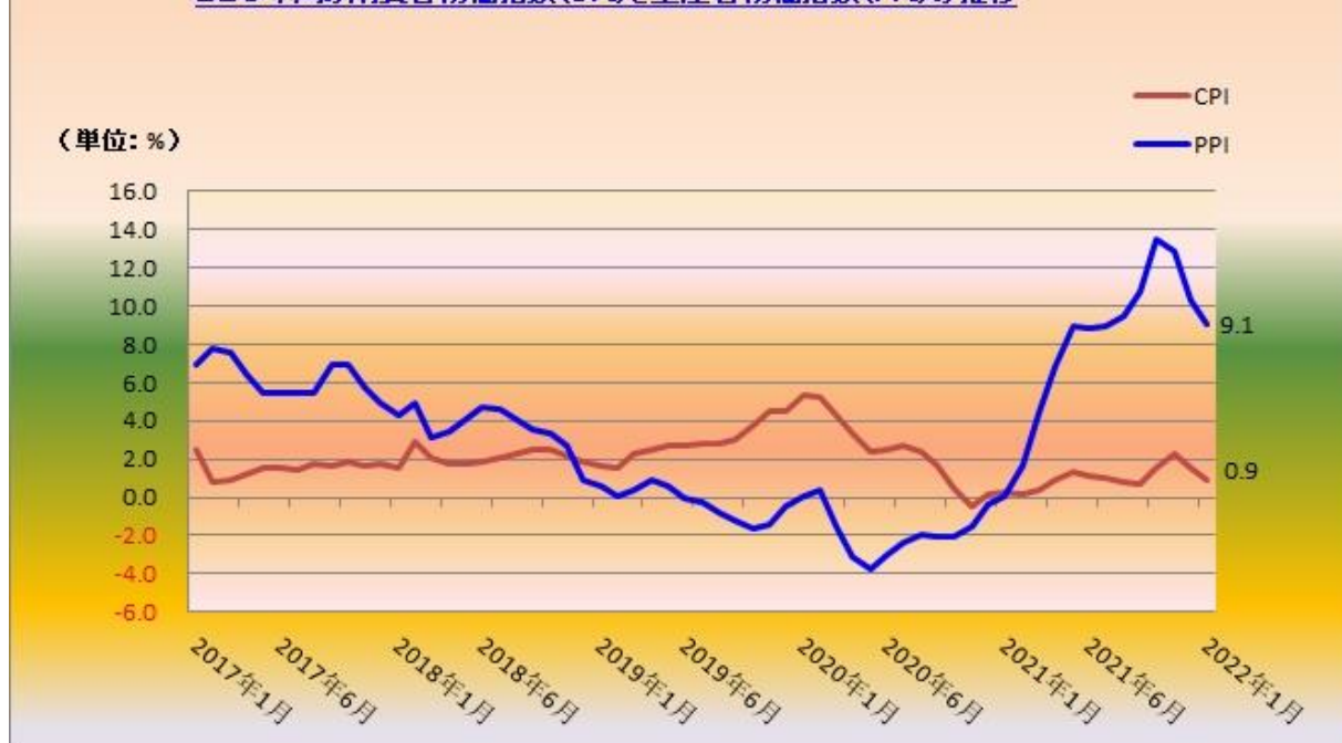
ここ5年間の消費者物価指数(CPI)と生産者物価指数(PPI)の推移