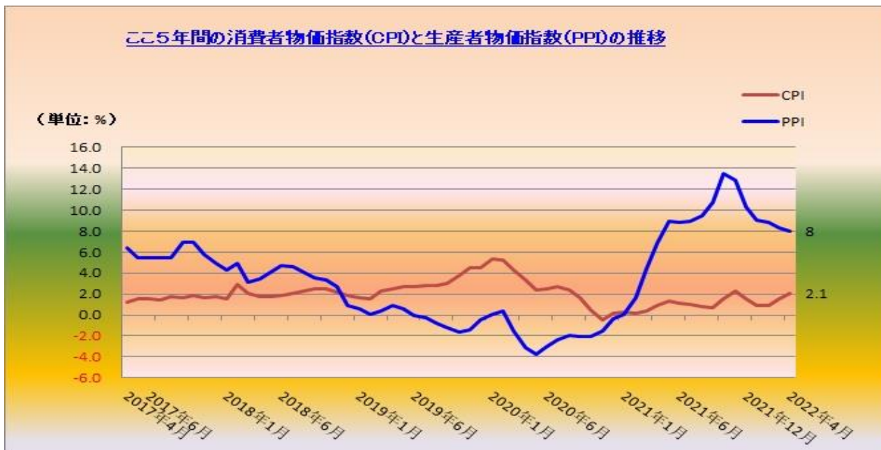
ここ5年間の消費者物価指数(CPI)と生産者物価指数(PPI)の推移